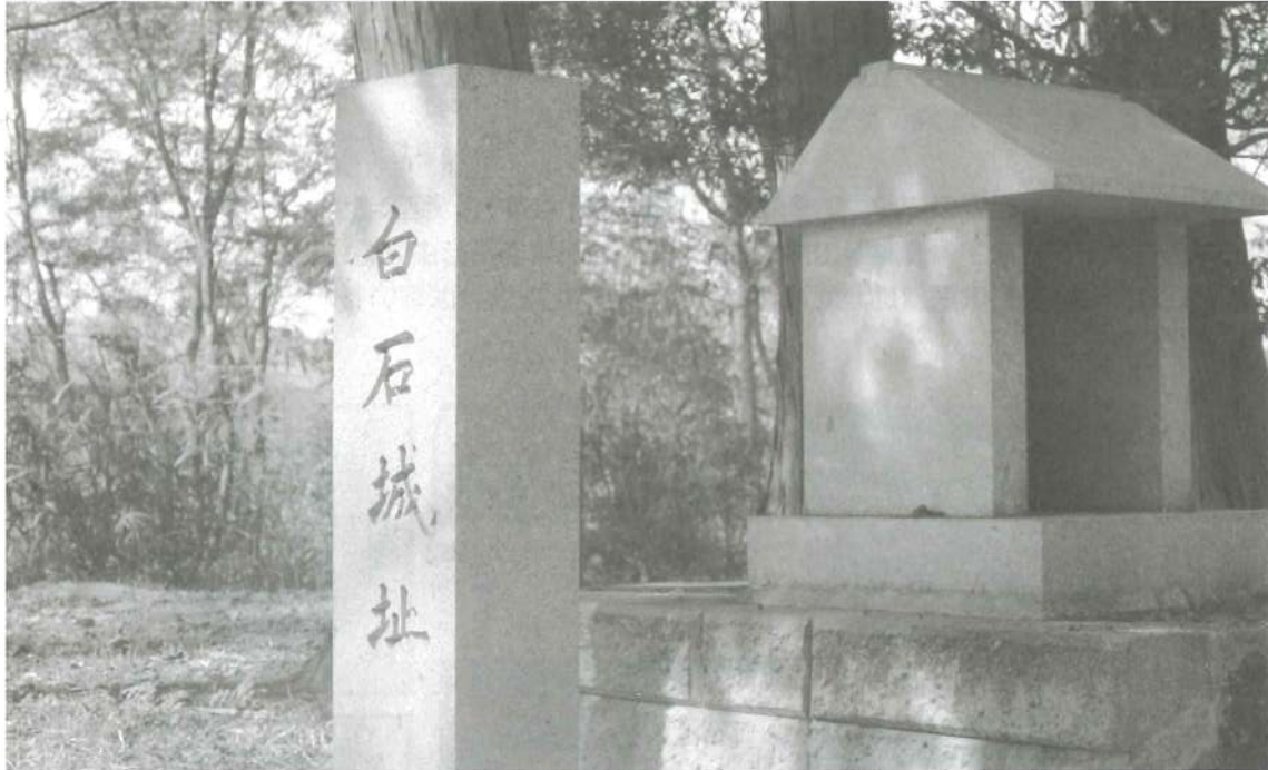
旧建部町指定文化財 白石城址

これらの歴史の痕跡は、今でも地域にひっそりと残っています。探しに出かけて、この地域の歴史に思いを馳せるのも楽しいかもしれません。